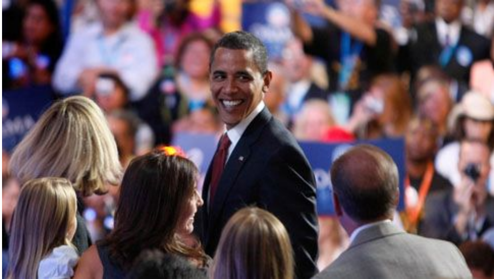
Barack Obama em campanha

Barack Hussein Obama , nasceu em 04 de Agosto de 1961, em Honolulu, ilhas do Havai, filho de pai queniano e mãe americana. Cresceu em ambiente de grande diversidade étnica e racial, tendo vivido no Havai e também na Indonésia.